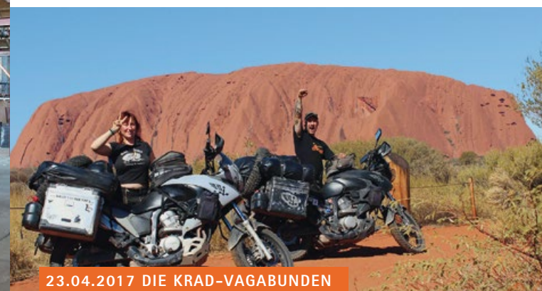
23.04.2017 DIE KRAD-VAGABUNDEN